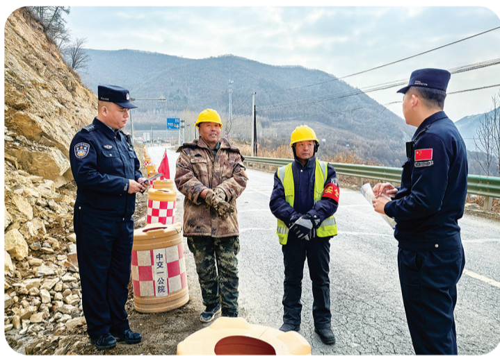
近日,白山边境管理支队金华边境派出所联合十四道沟交警中队开展“一盔一带,安全常在”为主题的道路交通安全法规宣传。

行为,最大程度地杜绝假冒伪劣食品在市场上流通。 闹枝镇将持续加强食品知识和法律法规的宣传力度,提高农村群众和食品经营主体的法律意识,督促引导食品企业严格自律,规范经营行为。不断完善日常监督检查机制,组织多种形式的专项检查、联合检查,加大检查力度,严厉打击销售假冒伪劣食品违法犯罪行为。