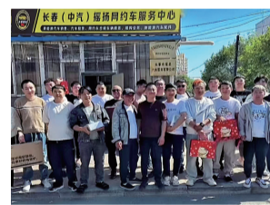
吉林吉大律师事务所

租赁与租购、充电设备经营、网约车平台运营和商务旅游包车等。现有小型预约出租车车辆300余台。公司以“预约出行,服务到家”为宗旨,全方位加强管理,保障优质服务。秉持以人为本,将乘车安全管理落实到运营全过程。