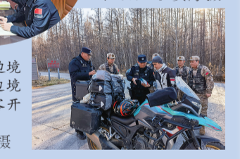
近日,延边边境管理支队双峰边境检查站积极向游客开展政策法规宣传。