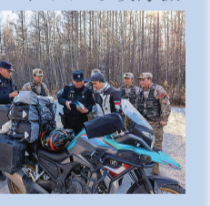
近日,延边边境管理支队双峰边境检查站积极向游客开展政策法规宣传。